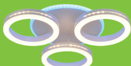
GSMCL-Smart59 Код: 800359